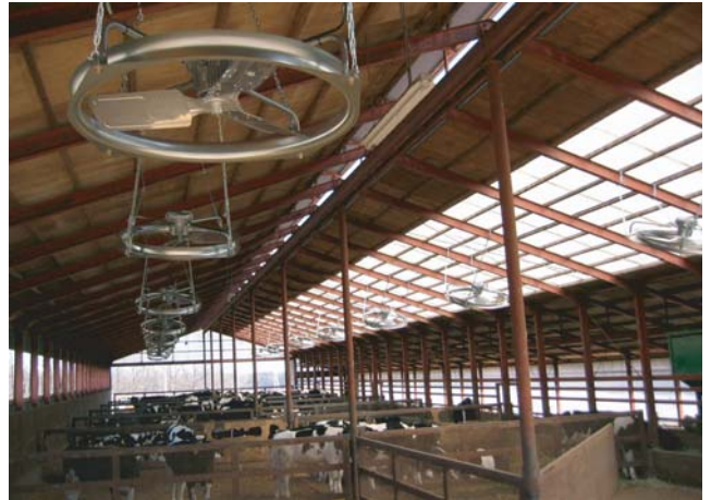
■ 畜舎用送風機 設置例(北海道士幌町)

当社は、この業界に参入して3年目となり、企業・製品の認知度の向上を図るために、この展示会に出展した。