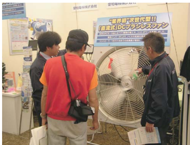
■ 展示ブースでの説明

今回の開催は2009年に北海道にて予定されており、当社としては、今回の経験を生かし、農業・酪農に貢献できる製品作りを推進し、展示会への参加を継続していきたい。