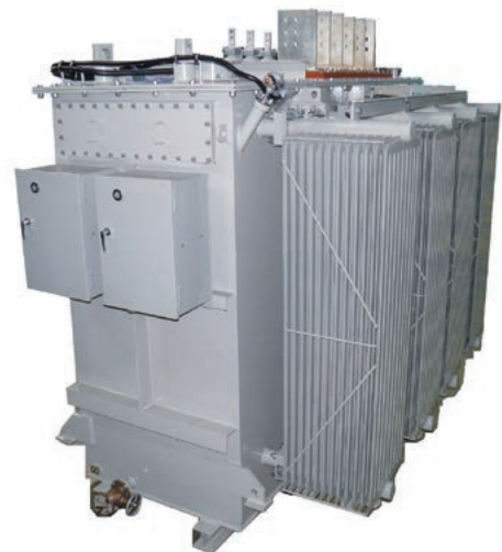
図1 電気炉用変圧器外観