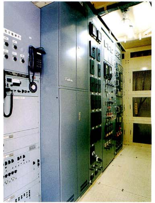
■内部には広い点検スペースを確保