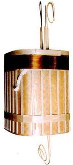
トランス巻線への適用