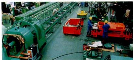
バイル自動鉄筋編成器