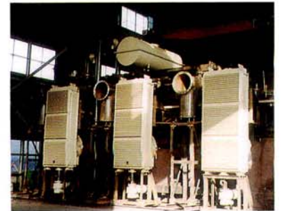
大型変圧器ケース