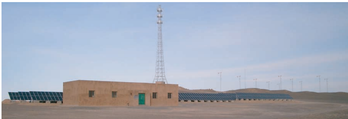
制御機器・蓄電池建屋