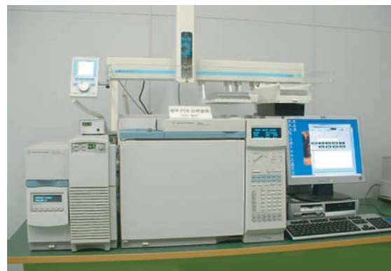
図2 定量分析装置外観