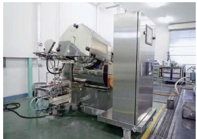
図3 据付後の開発品